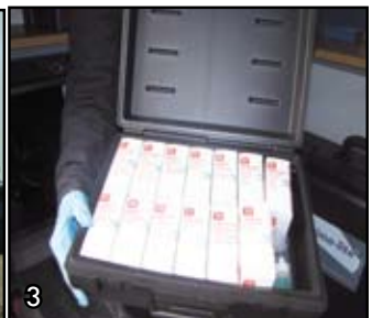
1. Kit de prueba de fluido seminal. 2. Crime Lite 3. Reactivos que permiten de determinar si la sustancia hallada es droga.