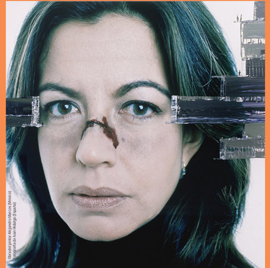
Obra del pintor Alejandro Marcos (México).