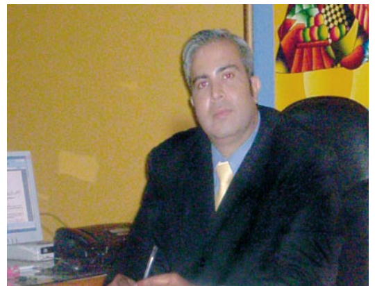
Abg. Jorge Sosa, Fiscal Adjunto Área II

Las áreas a cargo de esta Fiscalía Adjunta, comprende las fiscalías barriales, la Unidad Especializada en hechos punibles contra el ambiente y la Unidad Especializada de hechos punibles contra la propiedad intelectual de Asunción.