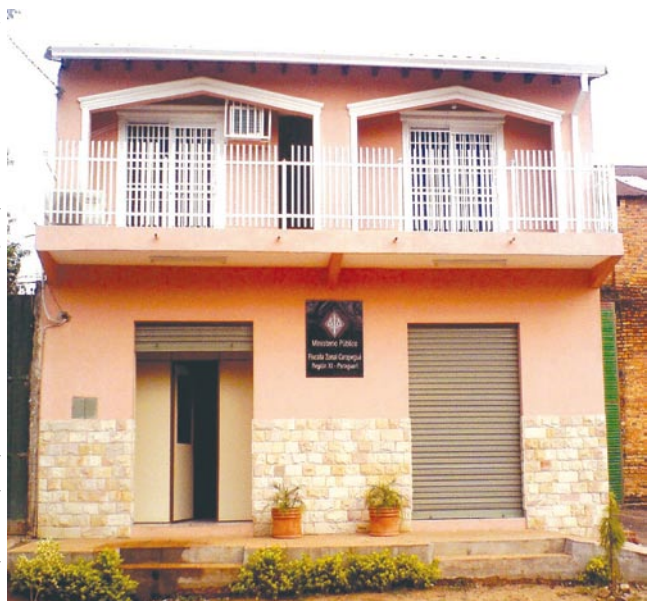
Nueva fiscalía zonal de Carapeguá

Se habilitaron dos fiscalías zonales: la de Caraguatay (Departamento de Cordillera) y la de Ybycuí (Departamento de Paraguari).