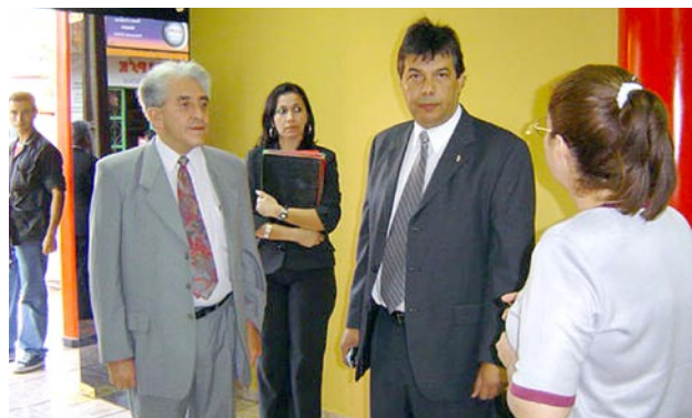
Entrega de móviles para las fiscalías del Área V

Las regiones de Alto Paraná y Canindeyú fueron fortalecidas para la eficiencia en su gestión fiscal, dotándolas de 26 computadoras y 17 acondicionadores de aire.