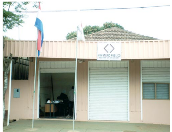
Sede de la Fiscalía de San Pedro

Esta Área cuenta con 23 agentes fiscales, quienes obtuvieron la disminución del índice de criminalidad en la zona, además, el finiquito y actualización de las causas, para dar una respuesta ágil a la demanda de la ciudadanía.