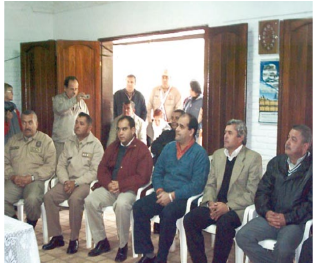
Reunión interinstitucional, con la Policía Nacional, Departamento de Cordillera

• Reunión internacional con autoridades argentinas en fechas 20 de junio de 2007, en Formosa, Argentina, en el marco de la ley que prohíbe la pesca extracción, recolección y acopio de la especie salminus maxillosus (dorado) y 21 de junio sobre la Lucha contra el tráfico ilícito de estupefacientes y contrabando.