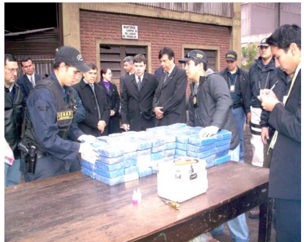
El narcotráfico es uno de los delitos más combatidos en esta Área