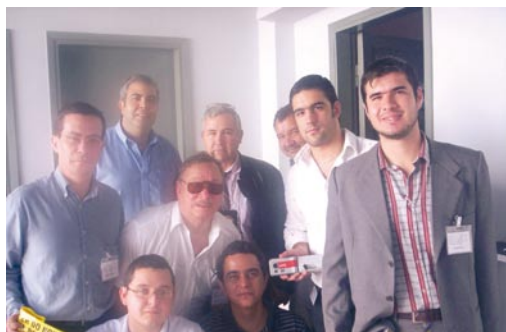
Equipo técnico de la Fiscalía Adjunta II

En el ejercicio de la representación institucional conferida por la Fiscalía General del Estado conforme a la resolución anteriormente invocada, esta Fiscalía Adjunta coordinó reuniones interinstitucionales, a fin de definir cursos de acción y operativos en el área, se citan a continuación algunas de ellas.