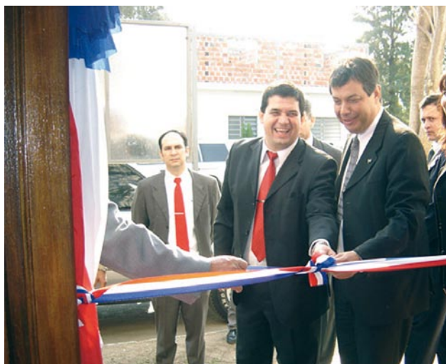
Habilitación de la sede fiscal en Pozo Colorado

Por otra parte, se recibió mobiliario para las diferentes dependencias, como fotocopiadoras, tandenes, equipos de comunicación, sillas interlocutorias, armarios, acondicionadores de aire, etc.