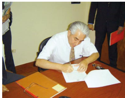
Acta de recepción de vehículos recibidos para el Área V

La región 2 Alto Paraná y Canindeyú, cuenta actualmente con un total de 31 agentes fiscales: veinte agentes fiscales en la sede regional y dos agentes fiscales por cada fiscalía zonal, a excepción de la fiscalía zonal de Santa Rita, que cuenta con un solo agente fiscal.