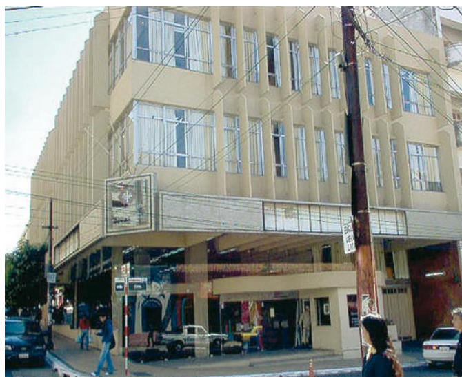
Edificio de la Unidad de Delitos Económicos y Anticorrupción, sobre la calle Chile, en la capital.

▶ Aprobación del manual de funciones y procedimientos por la Fiscalía General, entre otras metas.