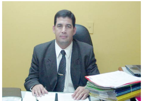
Abg. Hugo Velázquez, Fiscal Adjunto, Área VIII

► Actuaciones de los agentes fiscales. Se dictaron varias resoluciones tendientes a mejorar las actuaciones de los agentes fiscales coadyuvantes en la coordinación de causas penales, por motivos de audiencias preliminares y juicios orales y públicos; resoluciones de inhabiliciones y recusaciones planteadas en contra de los agentes fiscales del Área.