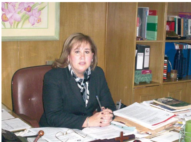
Fiscal Adjunta, Abg. Soledad Machuca

A través del Proyecto “Apoyo a la Reforma Judicial Penal”, cuya contraparte nacional fue el Ministerio Público, en la persona de la Fiscal Adjunta, Dra. Soledad Machuca, se elaboró una GUÍA METODOLÓGICA a fin de facilitar la ejecución y extensión del Plan Piloto entre el Ministerio Público y la Policía Nacional. De esta manera, se mejoraron los resultados en las investigaciones de hechos punibles.