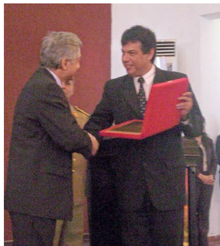
Acto de clausura del Proyecto “Apoyo a la Reforma Judicial Penal” de GTZ, en el colegio de Policía (Luque), en fecha 5 de junio de 2007

Disminución considerable de hechos punibles contra la propiedad de las personas. En el periodo comprendido de febrero – marzo 2007, se registró un ingreso de 205 causas sobre hechos punibles de abigeato y hurto y, en el periodo comprendido marzo – abril 2007 registró un ingreso de 143 causas, lo que arroja un resultado de 30% de disminución de ingresos de causas en los delitos mencionados.