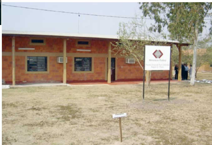
Fiscalía de Pozo Colorado

Se concretó una mejora sustancial en cuanto a recursos: se habilitó una fiscalía zonal en Pozo Colorado, con la designación de dos fiscales y funcionarios.