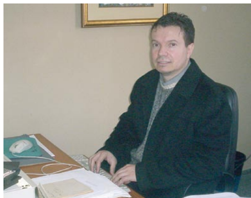
El Abg. Carlos Arregui, fiscal adjunto de la Unidad Especializada en Delitos Económicos y Anticorrupción.

La Fiscalía General del Estado, por Resolución F.G.E. N° 2.185 y 2.186 de 26 septiembre de 2005, reestructuró el ámbito de la competencia de las Fiscalías Adjuntas y aprobó el Manual de Funciones respectivamente.