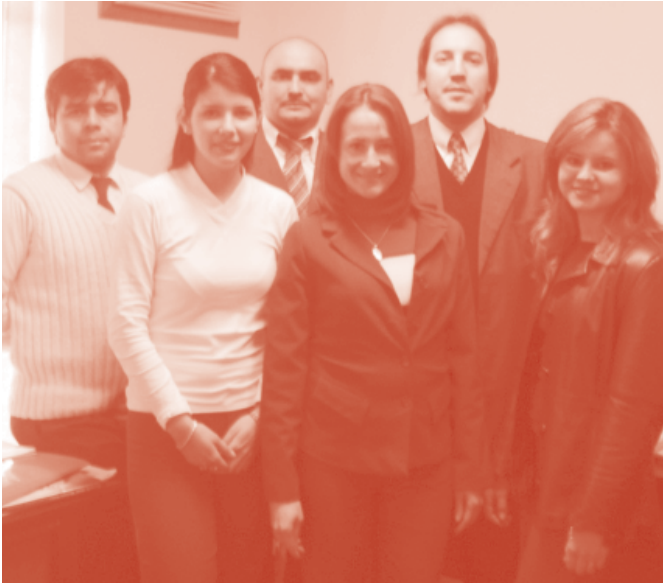
Plantel de Comunicaciones.