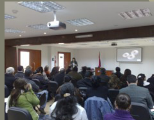
Jornada de capacitación del Centro de Entrenamiento del Ministerio Público

El 25 de febrero se realizó el cierre de la 6ª Mesa de Trabajo de la capacitación sobre el manual del “Plan Estratégico del Caso”, realizada por el Centro de Entrenamiento del Ministerio Público, con el apoyo de La Oficina de las Naciones Unidas Contra la Droga y el Delito (UNODC).